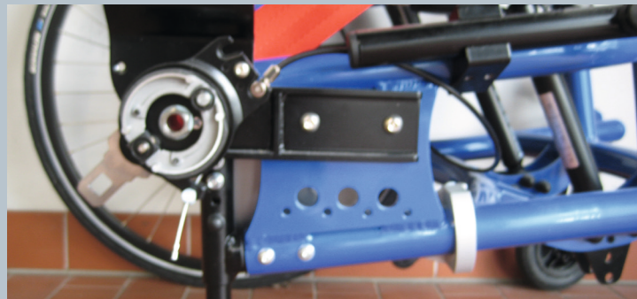
Zwei vordere Kraftknotensysteme mit jeweils einer Schwerlastöse für Spannretractor oder Statigurt.