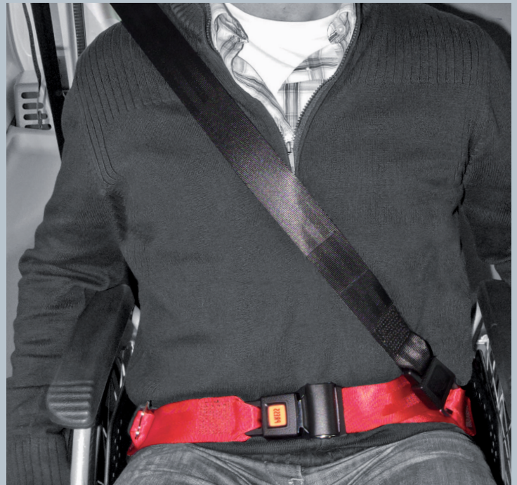
Der Beckengurt (rot) ist fester Bestandteil des Kraftknotens. Der Schulterschräggurt (schwarz) ist im KMP/Kfz montiert.

Der vorliegende AMF-Bruns Kraftknotenadapter ist in Anlehnung an DIN 75078-2 / ISO 10542 getestet. Der Rollstuhltest nach ISO 7176-19 obliegt dem Rollstuhlhersteller.