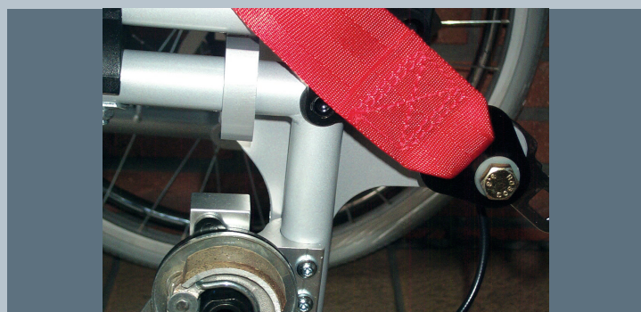
Zwei hintere Kraftknotensysteme mit jeweils einer genormten Schwerlastöse für Spannretractor. Der Beckengurt ist bereits fest montiert.