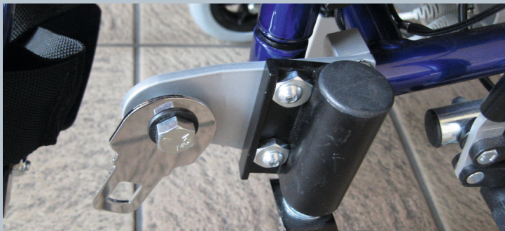
Zwei vordere Kraftknotensysteme mit jeweils einer Schwerlastöse für Spannretraktor oder Statikgurt.