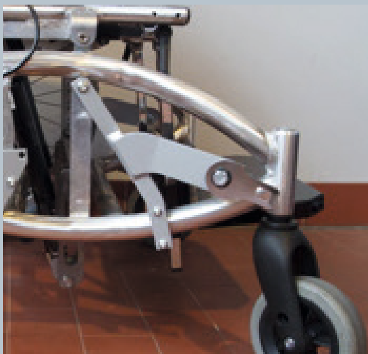
Zwei vordere Kraftknotensysteme mit jeweils einer Schwerlastöse für Spannretractor oder Statikgurt.