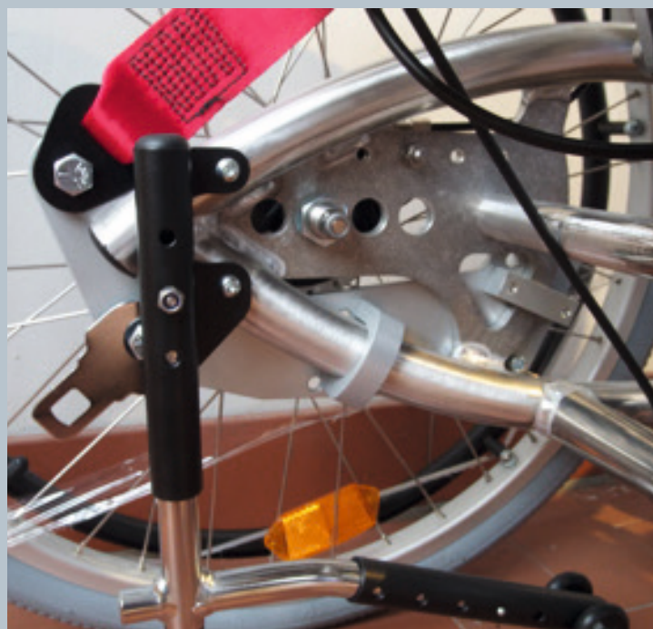
Zwei hintere Kraftknotensysteme mit jeweils einer genormten Schwerlastöse für Spannretractor. Der Beckengurt ist bereits fest montiert.