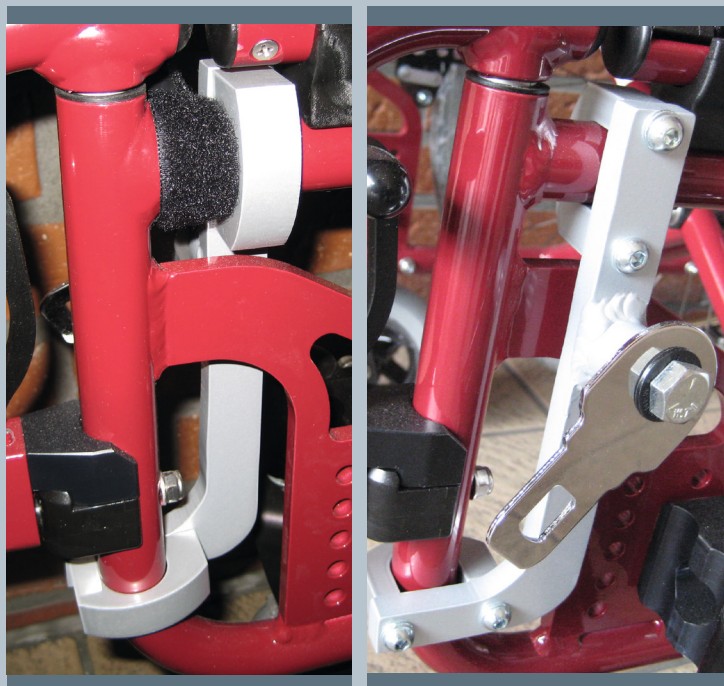
Zwei vordere Kraftknotensysteme mit jeweils einer Schwerlastöse für Spannretractor oder Statikgurt.