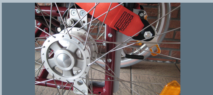
Zwei hintere Kraftknotensysteme mit jeweils einer genormten Schwerlastöse für Spannretractor. Der Beckengurt ist bereits fest montiert.