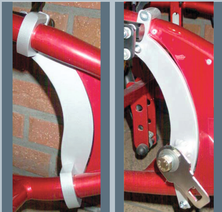
Zwei vordere Kraftknotensysteme mit jeweils einer Schwerlastöse für Spannretractor oder Statikgurt.