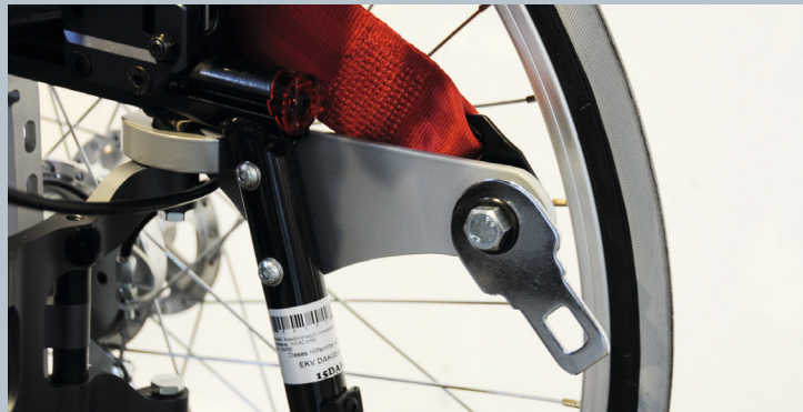
Zwei hintere Kraftknotensysteme mit jeweils einer genormten Schwerlastöse für Spannretractor. Der Beckengurt ist bereits fest montiert.