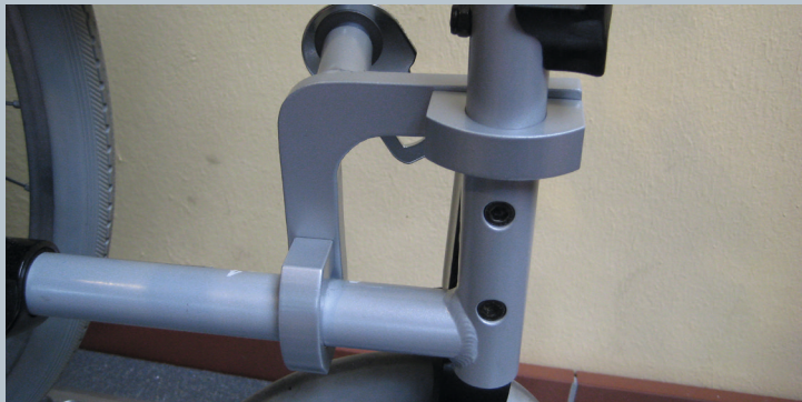
Zwei vordere Kraftknotensysteme mit jeweils einer Schwerlastöse für Spannretractor oder Statigurt.