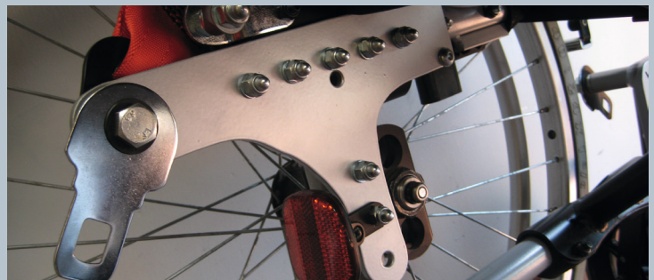
Zwei hintere Kraftknotensysteme mit jeweils einer genormten Schwerlastöse für Spannretractor. Der Beckengurt ist bereits fest montiert.