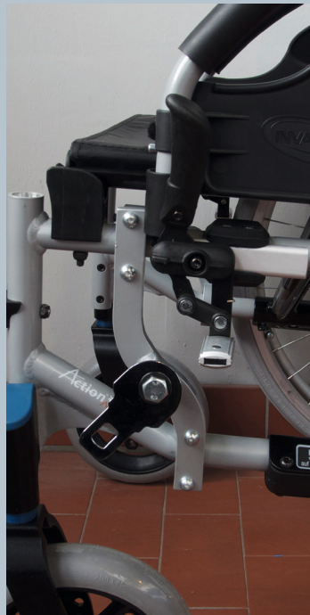
Zwei vordere Kraftknotensysteme mit jeweils einer Schwerlastöse für Spannretractor oder Statikgurt.