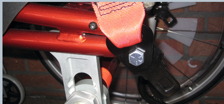
Zwei vordere Kraftknotensysteme mit jeweils einer Schwerlastöse für Spannretractor oder Statikgurt.