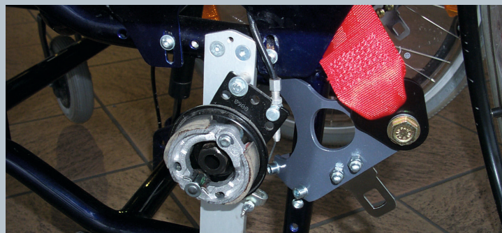
Zwei hintere Kraftknotensysteme mit jeweils einer genormten Schwerlastöse für Spannretractor. Der Beckengurt ist bereits fest montiert.