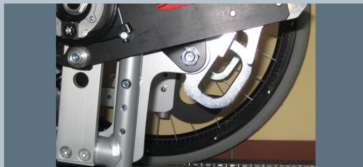
Zwei vordere Kraftknotensysteme mit jeweils einer Schwerlastöse für Spannretractor oder Statikgurt.