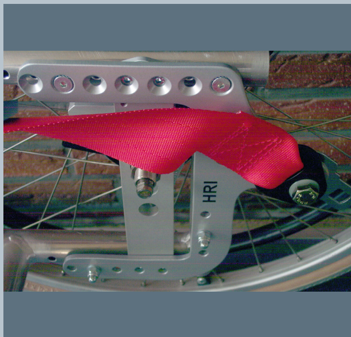
Zwei hintere Kraftknotensysteme mit jeweils einer genormten Schwerlastöse für Spannretractor. Der Beckengurt ist bereits fest montiert.