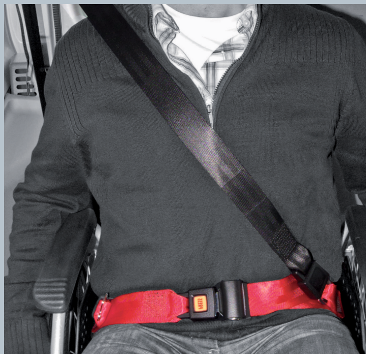
Der Beckengurt (rot) ist fester Bestandteil des Kraftknotens. Der Schulterschräggurt (schwarz) ist im KMP/Kfz montiert.

Der vorliegende AMF-Bruns Kraftknotenadapter ist in Anlehnung an DIN 75078-2 / ISO 10542 getestet. Der Rollstuhltest nach ISO 7176-19 obliegt dem Rollstuhlhersteller.