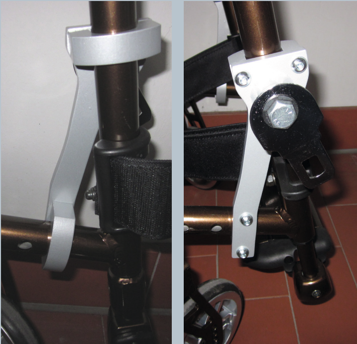
Zwei vordere Kraftknotensysteme mit jeweils einer Schwerlastöse für Spannretractor oder Statikgurt.