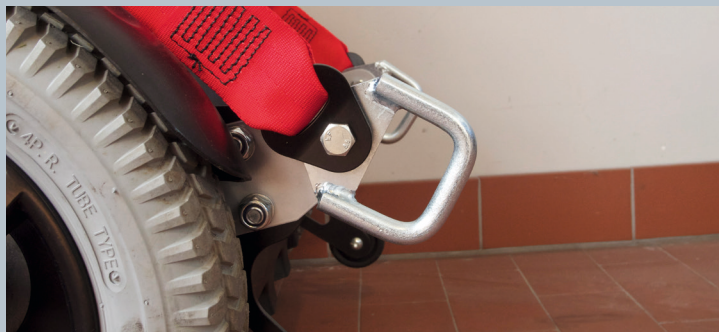
Zwei vordere Kraftknotensysteme mit jeweils einer Schwerlastöse für Spannretractor oder Statigurt.