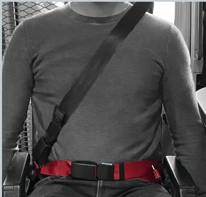
Der Beckengurt (rot) ist fester Bestandteil des Kraftknoten. Der Schultersträggurt (schwarz) ist im KMP/Kfz montiert.

Der vorliegende AMF-Bruns Kraftknotenadapter ist in Anlehnung an DIN 75078-2 / ISO 10542 getestet. Der Rollstuhltest nach ISO 7176-19 obliegt dem Rollstuhlhersteller.