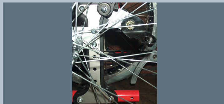
Zwei vordere Kraftknotensysteme mit jeweils einer Schwerlastöse für Spannretractor oder Statikgurt.