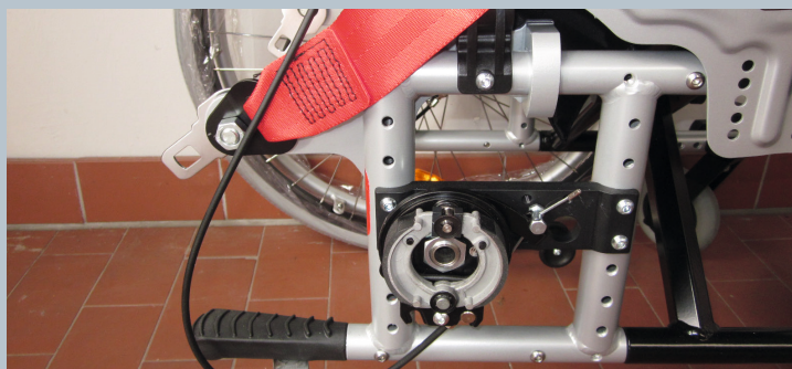
Zwei hintere Kraftknotensysteme mit jeweils einer genormten Schwerlastöse für Spannretractor. Der Beckengurt ist bereits fest montiert.