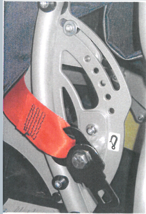
Zwei hintere Kraftknotensysteme mit jeweils einer genormten Schwerlastöse für Spannretractor. Der Beckengurt ist bereits fest montiert.