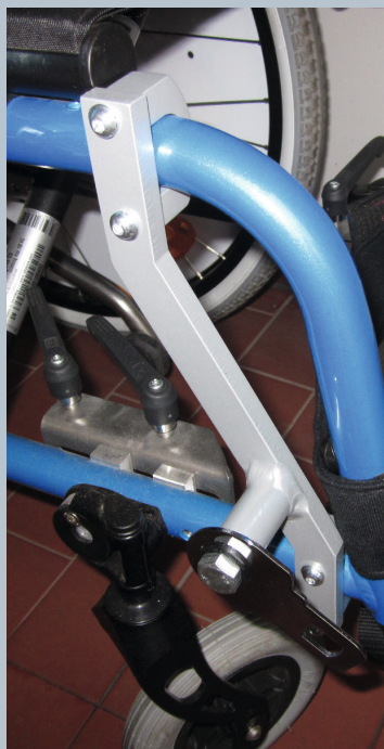
Zwei vordere Kraftknotensysteme mit jeweils einer Schwerlastöse für Spannretractor oder Statikgurt.