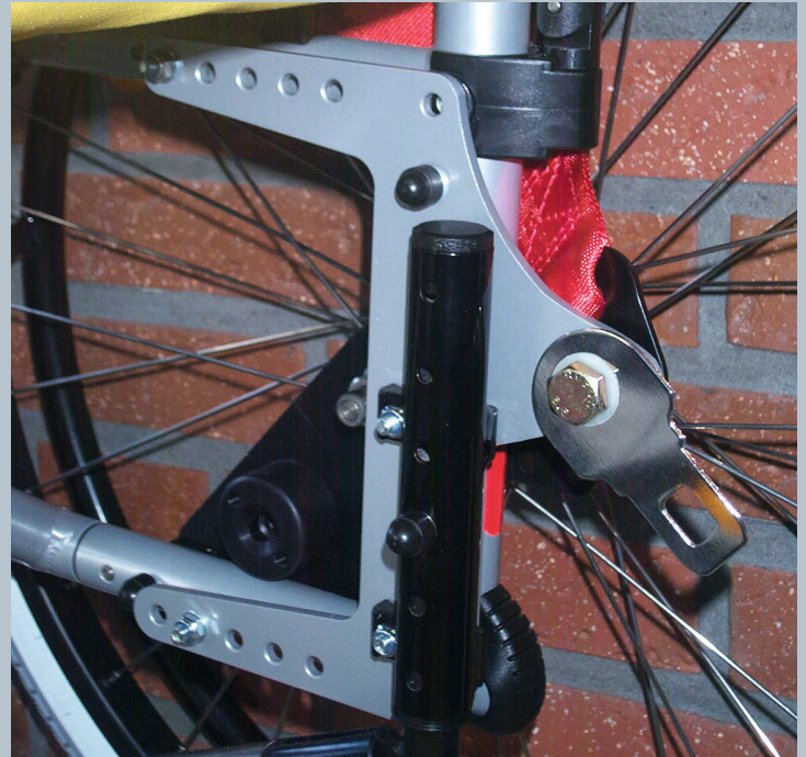
Zwei hintere Kraftknotensysteme mit jeweils einer genormten Schwerlastöse für Spannretractor. Der Beckengurt ist bereits fest montiert.