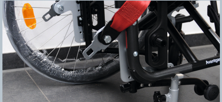
Zwei hintere Kraftknotensysteme mit jeweils einer genormten Schwerlastöse für Spannretractor. Der Beckengurt ist bereits fest montiert.