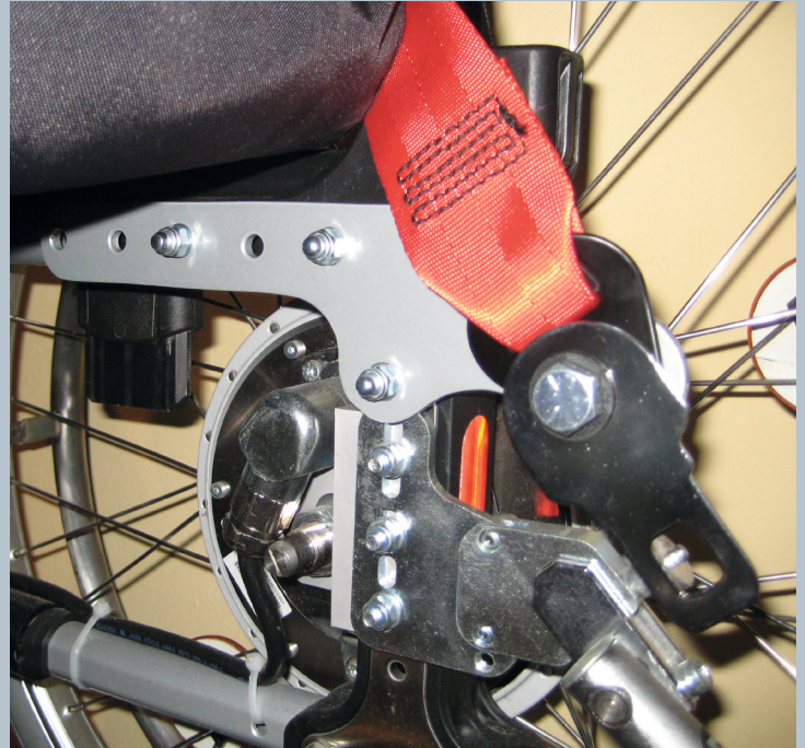
Zwei hintere Kraftknotensysteme mit jeweils einer genormten Schwerlastöse für Spannretractor. Der Beckengurt ist bereits fest montiert.