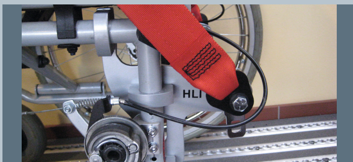
Zwei hintere Kraftknotensysteme mit jeweils einer genormten Schwerlastöse für Spannretractor. Der Beckengurt ist bereits fest montiert.