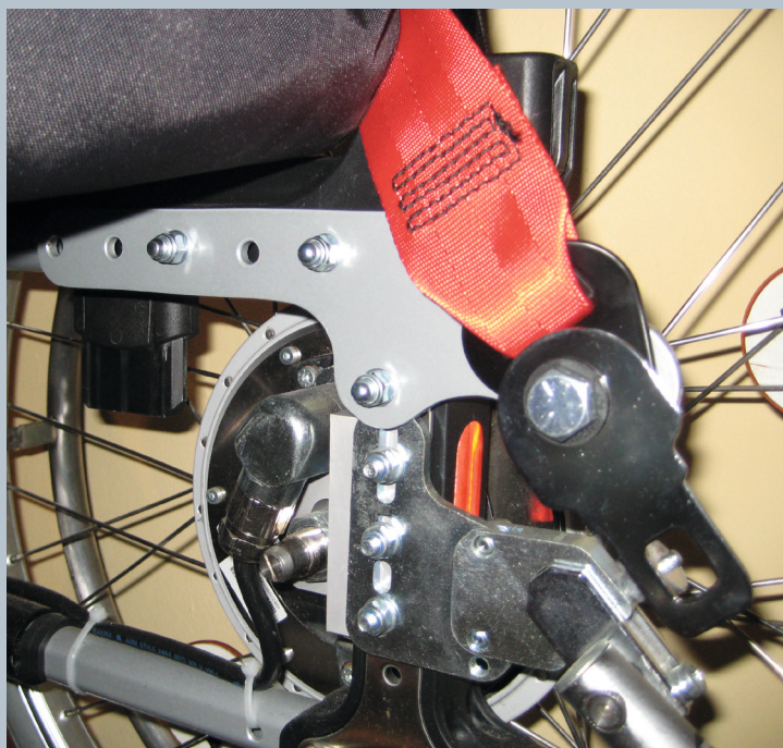
Zwei hintere Kraftknotensysteme mit jeweils einer genormten Schwerlastöse für Spannretractor. Der Beckengurt ist bereits fest montiert.