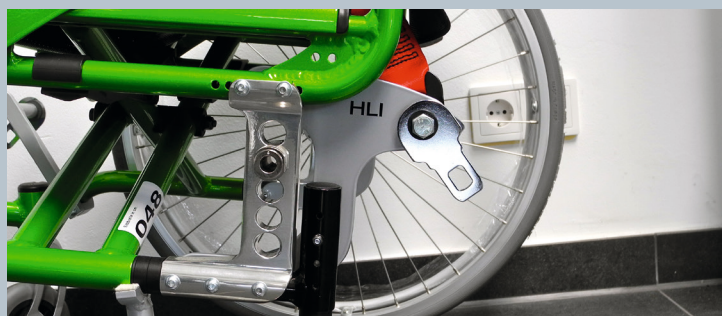
Zwei vordere Kraftknotensysteme mit jeweils einer Schwerlastöse für Spannretractor oder Statigurt.