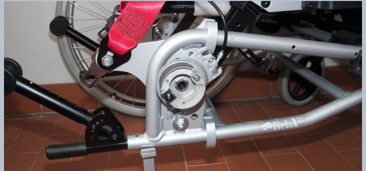
Zwei hintere Kraftknotensysteme mit jeweils einer genormten Schwerlastöse für Spannretractor. Der Beckengurt ist bereits fest montiert.