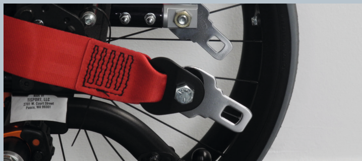
Zwei vordere Kraftknotensysteme mit jeweils einer Schwerlastöse für Spannretractor oder Statikgurt.