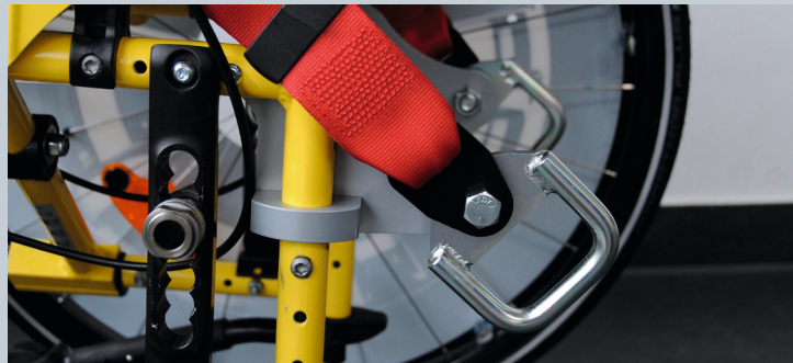
Zwei vordere Kraftknotensysteme mit jeweils einer Schwerlastöse für Spannretractor oder Statikgurt.