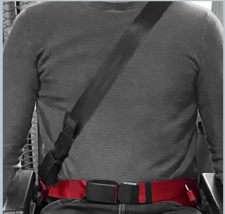
Der Beckengurt (rot) ist fester Bestandteil des Kraftknotensystems. Der Schulterschräggurt (schwarz) ist im KMP/Kfz montiert.

Der vorliegende AMF-Bruns Kraftknotenadapter ist in Anlehnung an DIN 75078-2 / ISO 10542 getestet. Der Rollstuhltest nach ISO 7176-19 obliegt dem Rollstuhlhersteller.