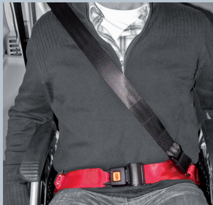
Der Beckengurt (rot) ist fester Bestandteil des Kraftknotens. Der Schulterschräggurt (schwarz) ist im KMP/Kfz montiert.

Der vorliegende AMF-Bruns Kraftknotenadapter ist in Anlehnung an DIN 75078-2 / ISO 10542 getestet. Der Rollstuhltest nach ISO 7176-19 obliegt dem Rollstuhlhersteller.