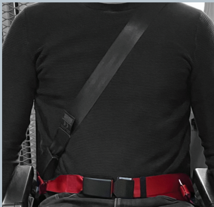
Der Beckengurt (rot) ist fester Bestandteil des Kraftknotensystems. Der Schulterschräggurt (schwarz) ist im KMP/Kfz montiert.

Der vorliegende AMF-Bruns Kraftknotenadapter ist in Anlehnung an DIN 75078-2 / ISO 10542 getestet. Der Rollstuhltest nach ISO 7176-19 obliegt dem Rollstuhlhersteller.