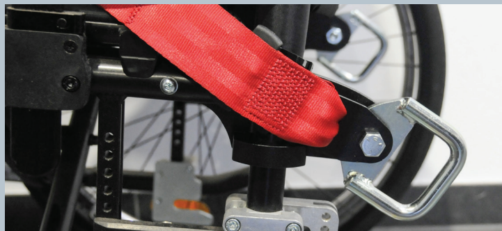
Zwei vordere Kraftknotensysteme mit jeweils einer Schwerlastöse für Spannretractor oder Statikgurt.