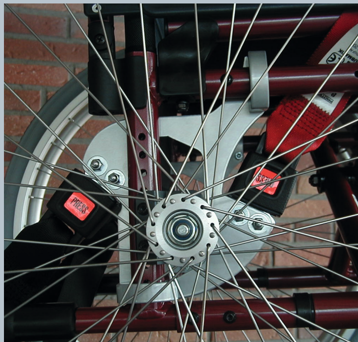
Zwei hintere Kraftknotensysteme mit jeweils einer genormten Schwerlastöse für Spannretractor. Der Beckengurt ist bereits fest montiert.