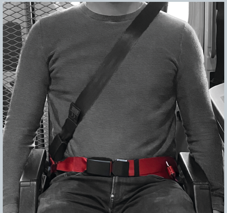
Der Beckengurt (rot) ist fester Bestandteil des Kraftknotens. Der Schultersträggurt (schwarz) ist im KMP/Kfz montiert.

Der vorliegende AMF-Bruns Kraftknotenadapter ist in Anlehnung an DIN 75078-2 / ISO 10542 getestet. Der Rollstuhltest nach ISO 7176-19 obliegt dem Rollstuhlhersteller.