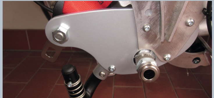
Zwei vordere Kraftknotensysteme mit jeweils einer Schwerlastöse für Spannretractor oder Statigurt.