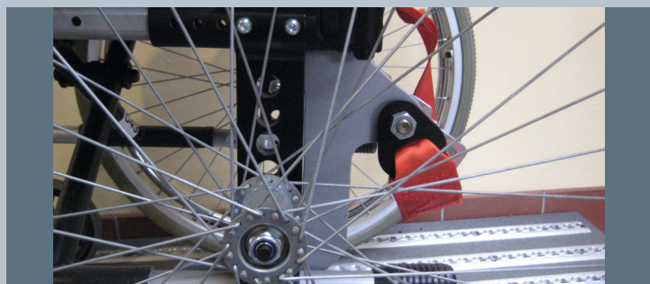
Zwei vordere Kraftknotensysteme mit jeweils einer Schwerlastöse für Spannretractor oder Statikgurt.