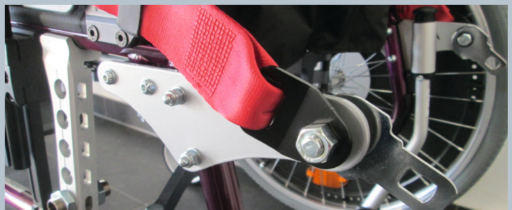
Zwei vordere Kraftknotensysteme mit jeweils einer Schwerlastöse für Spannretractor oder Statikgurt.