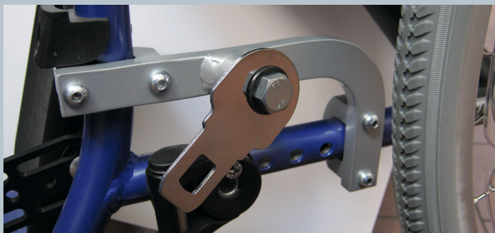
Zwei vordere Kraftknotensysteme mit jeweils einer Schwerlastöse für Spannretractor oder Statikgurt.