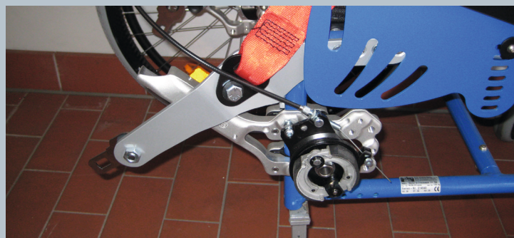
Zwei hintere Kraftknotensysteme mit jeweils einer genormten Schwerlastöse für Spannretractor. Der Beckengurt ist bereits fest montiert.