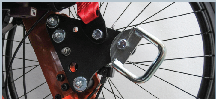
Zwei vordere Kraftknotensysteme mit jeweils einer Schwerlastöse für Spannretractor oder Statikgurt.