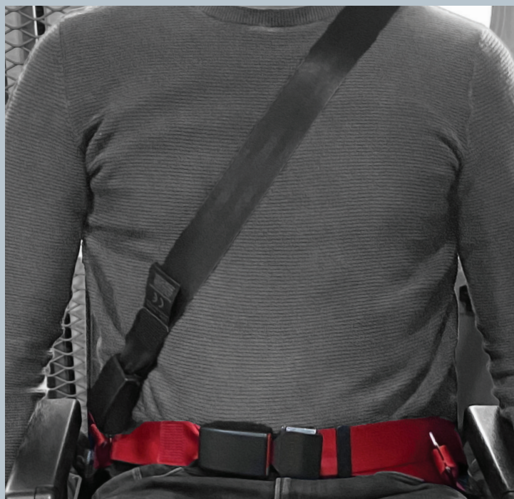
Der Beckengurt (rot) ist fester Bestandteil des Kraftknotensystems. Der Schulterschräggurt (schwarz) ist im KMP/Kfz montiert.

Der vorliegende AMF-Bruns Kraftknotenadapter ist in Anlehnung an DIN 75078-2 / ISO 10542 getestet. Der Rollstuhltest nach ISO 7176-19 obliegt dem Rollstuhlhersteller.