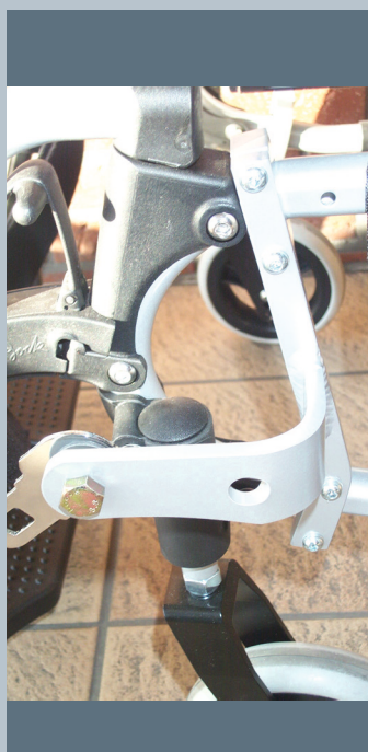
Zwei vordere Kraftknotensysteme mit jeweils einer Schwerlastöse für Spannretractor oder Statikgurt.