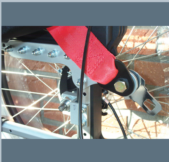
Zwei hintere Kraftknotensysteme mit jeweils einer genormten Schwerlastöse für Spannretractor. Der Beckengurt ist bereits fest montiert.